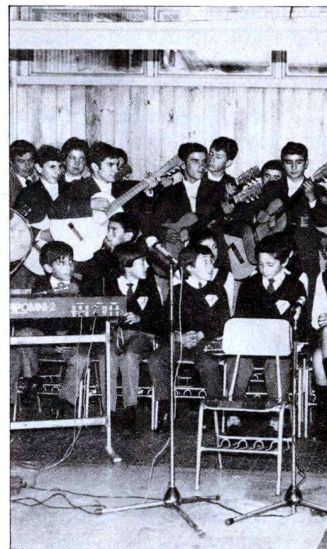
Es posible organizar en el colegio un pequeño ciclo de conciertos.

Crear un consejo cultural formado por diversos estamentos de la comunidad escolar (autoridades del establecimiento, profesores del área artística, representantes del centro de alumnos, de los apoderados, etc.). Es recomendable que estas personas